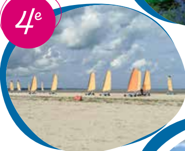
Char à voile